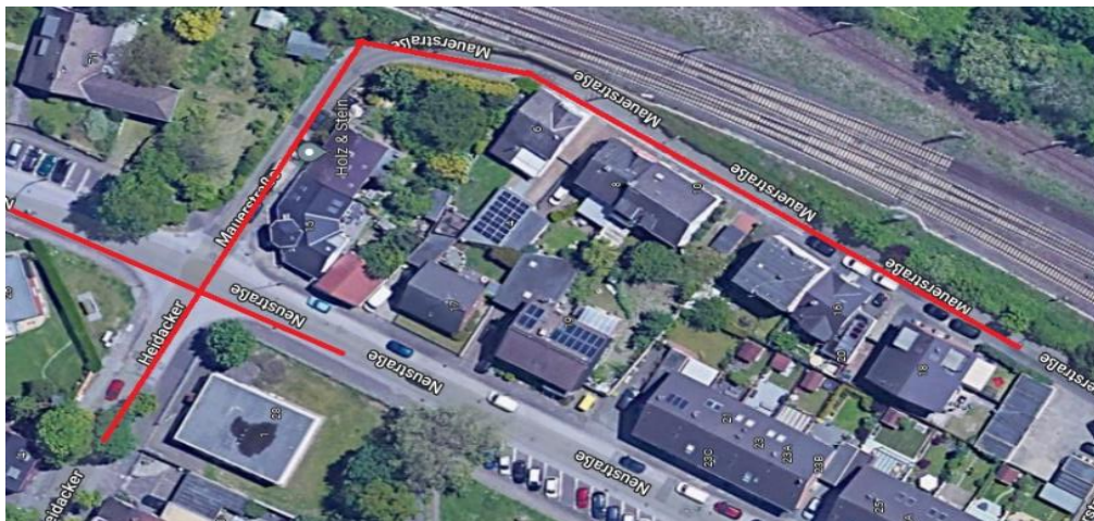
Abbildung 1: Luftbild des Untersuchungsbereichs

Das Planungsgebiet liegt in Bergheim, einem südwestlichen Stadtteil von Duisburg. Die Flächennutzung ist in der direkten Umgebung durch angrenzende Wohnbebauungen und Gleisstrecken geprägt.