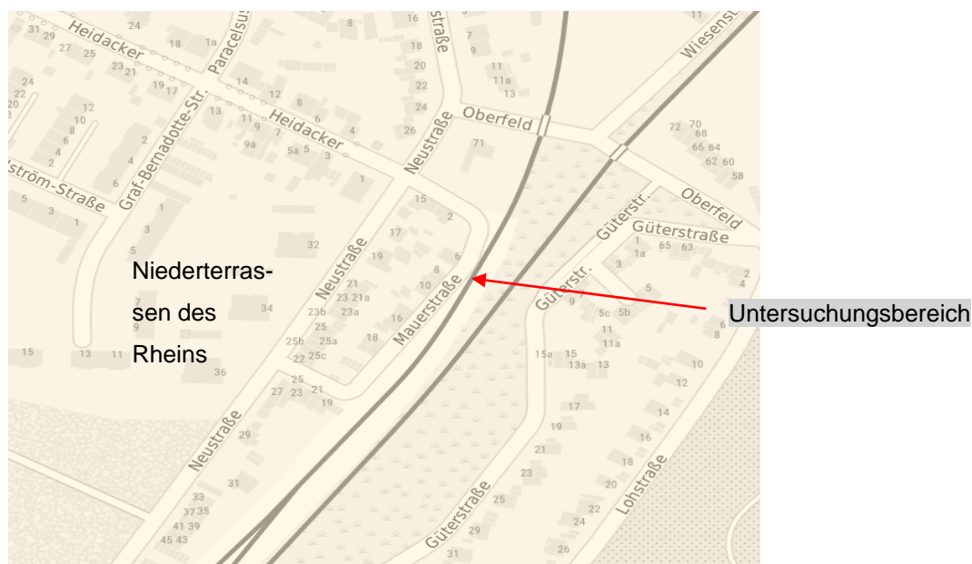
Abbildung 2: Geologische Übersicht, Quelle: [U2]

Wegen der anthropogen beeinflussten Lage des Planungsgebiets ist davon auszugehen, dass der natürliche Boden von angeschütteten Materialien überlagert wird und mit einer Straßendecke versiegelt ist.